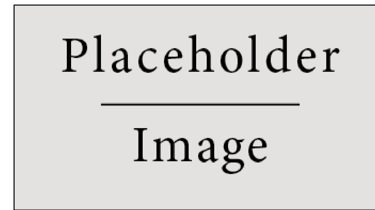
Figure 2: Figure caption

placerat eget tincidunt nec, ornare in nisl. In placerat.