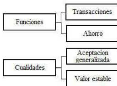
Figura 2. Dinero sus funciones y cualidades